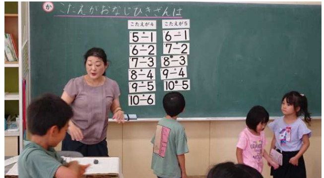
すると別の児童が踏み台の椅子を持ってきてくれ、無事に「7-2」のカードを所定の位置に貼ることができた。

6年生の算数は、分数のわり算はわる数の逆数かける意味を考える学習でした。授業では次の写真のように、ホワイトボードを利用して問題を解決するために働かせた数学的な見方・考え方を色分けしたあと、電子黒板を利用して児童それぞれがどの見方・考え方を働かせて解決したのか一目でわかるように各自のノートの背景色を変えていました。アナログとデジタルが融合されており、担任の毎日の授業づくりの工夫が伝わってくる場面でした。