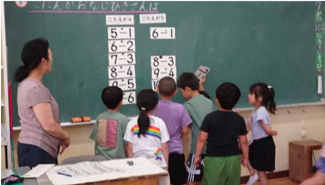
ある児童が「7-2」のカードを黒板に貼ろうとしているが「6-1」と「8-3」の間に届かなくて困っている。

1年生の算数は、答えが同じになる引き算の式を考える学習でした。授業では次の写真のような、他者を思いやる児童の姿が見られました。担任の毎日の学級経営の成果が表れた場面でした。